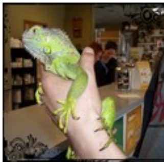
Un iguane