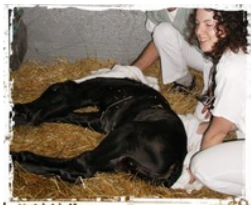
La naissance d'un poulain