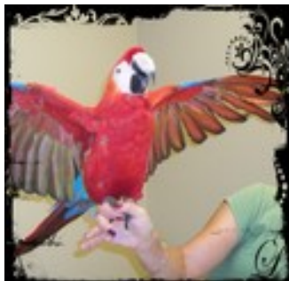
Un Ara Macao ( www.cliniqueveterinairegavuin.com )

Un-e vétérinaire doit aimer les animaux, bien-sûr, mais il ou elle doit également être patient-e, soigneux-se et intraitable sur les conditions d'asepsie. Un-e vétérinaire à la campagne devra également être disponible et prêt à se déplacer. En ville, de plus en plus, il faut être prêt à prendre en charge les "nac" : nouveaux animaux de compagnie.