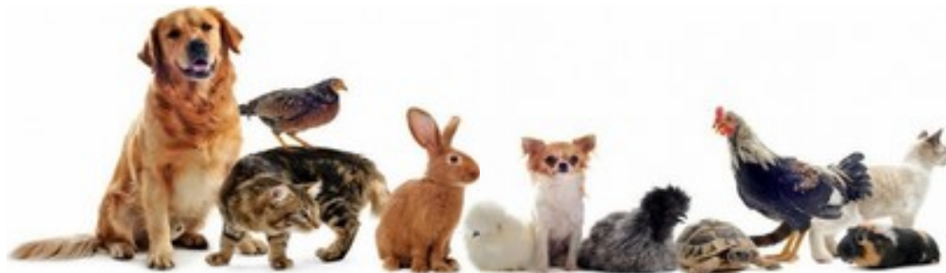
Page d'accueil d'une clinique vétérinaire ( www.minidevis.com )

Réalisation A.Meunier d'après la fiche CIDJ, www.concours-agro-veto.net , et http://www.devenir-veto.com