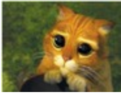
Chat espérant des soins

Aucune matière n'est à négliger, coefficients du concours :