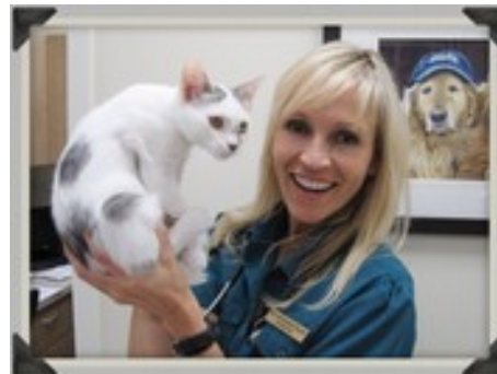
Une vétérinaire en action ( www.infoveto.com )