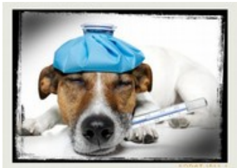
Rex a un coup de mou ( www.forma-search.com )